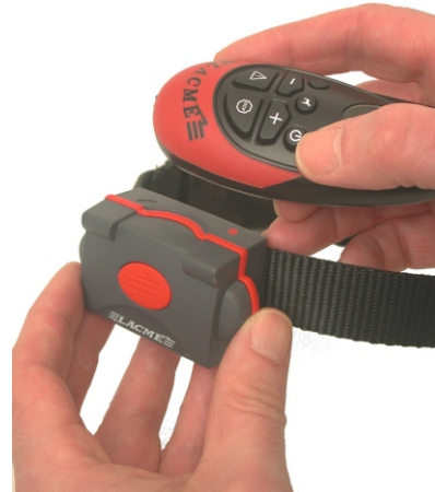
Indítsa be a nyakörvet