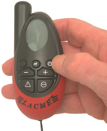
Indítsa be a távirányítót

A 300 méteres Nevelési modelltől kezdve több nyakörvet is irányíthat. A 300-as modellel két nyakörvet, az 500 méteres modellel akár 4 nyakörvet. Az egyes nyakörveknek a távirányítóval való szinkronizálásához az alábbi eljárást kövesse.